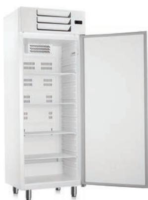
Armoire pâtisserie positive porte pleine