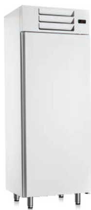
Armoire pâtisserie négative porte pleine